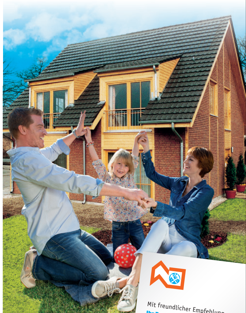
Alle Bilder und Texte urheberrechtlich geschützt. 1XVI106